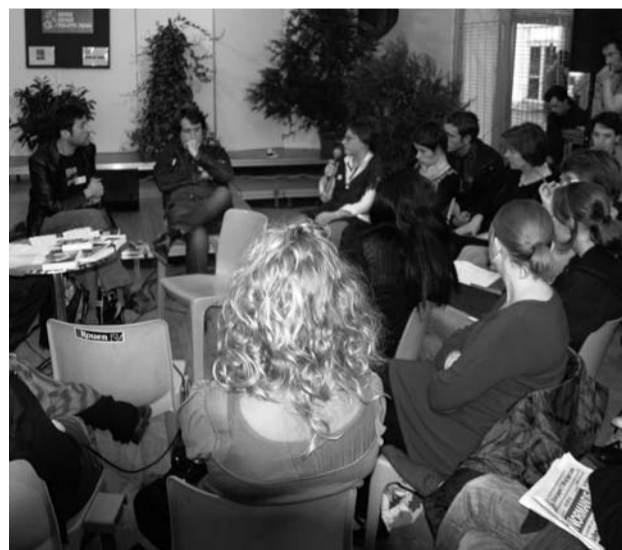
TABLE RONDE « ILLETTRISME ET LIGNE EDITORIALE : QUELS RAPPORTS ? »

Cette matinée permettra de retracer et resituer les sources de ce mal-être social, dont les chiffres sont inquiétants en Haute-Normandie et de comprendre les mécanismes et facteurs pouvant contribuer à l'émergence de situations d'illettrisme. Pratiques, pédagogies et perspectives d'action sur le plan local et national seront mises en lumière.